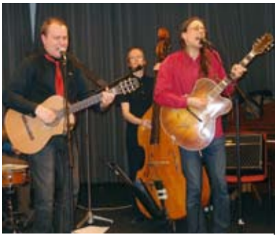
Kosminen Säteily esiintyi SKP:n piirin juhlassa Kirjalla.