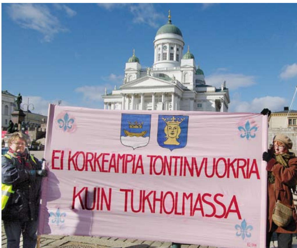
Helsingin kaupunki on nostamassa 170 kiinteistön maanvuokria 10-15-kertaisiksi.